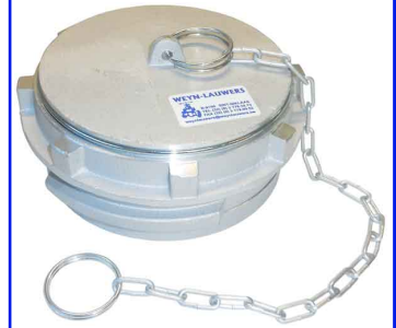
GUILLEMIN stop met grendel werkdruk max. 16 bar aluminium met witte NBR dichting RVS 316 met viton dichting