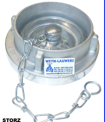
STORZ stop met ketting nok : 44 - 52 - 66 - 81 - 105 - 115 - 133 - 160 werkdruk max. 16 bar aluminium met NBR dichting