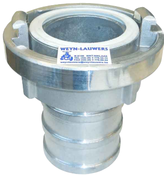
STORZ slangtule diam. 25 mm tot diam. 150 mm nok : 44 - 52 - 66 - 81 - 105 - 115 - 133 - 160 aluminium met NBR dichting