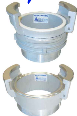
GUILLEMIN M-schroefdraad 3/4" tot 4" met of zonder grendel werkdruk max. 16 bar aluminium met witte NBR dichting RVS 316 met viton dichting