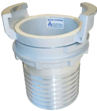
GUILLEMIN slangtule met grendel diam. 20 mm tot diam. 152 mm werkdruk max. 16 bar aluminium met witte NBR dichting RVS 316 met viton dichting