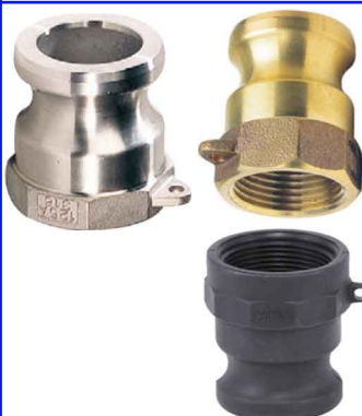
CAM-LOCK ADAPTER A 1/2" tot 4" bsp binnendraad