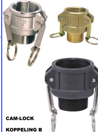
CAM-LOCK KOPPELING B 1/2" tot 4" bsp buitendraad