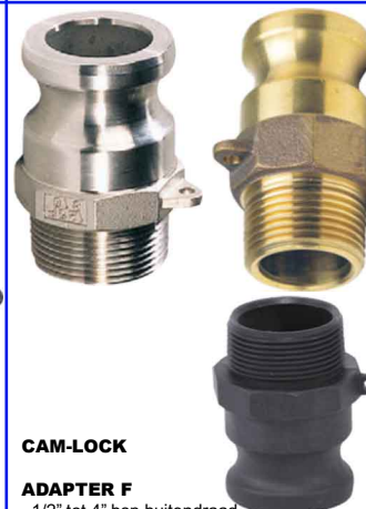
CAM-LOCK ADAPTER F 1/2" tot 4" bsp buitendraad