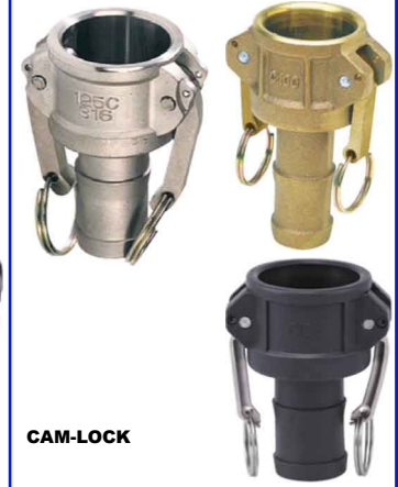
CAM-LOCK SLANGTULE KOPPELING C