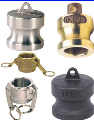
CAM-LOCK CAP KOPPELING DC STOP ADAPTER DP