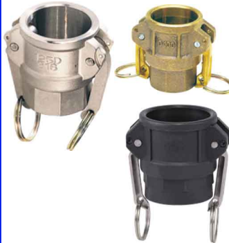
CAM-LOCK KOPPELING F 1/2" tot 4" bsp binnendraad