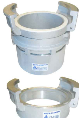
GUILLEMIN F-schroefdraad 3/4" tot 4" met of zonder grendel werkdruk max. 16 bar aluminium met witte NBR dichting RVS 316 met viton dichting