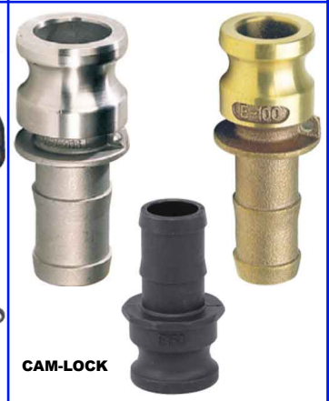
CAM-LOCK SLANGTULE ADAPTER E