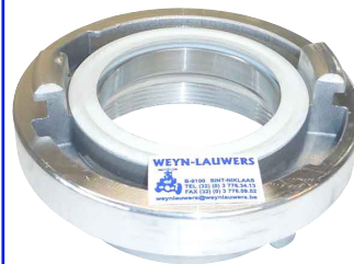
STORZ F-schroefdraad 1" tot 6" nok : 44 - 52 - 66 - 81 - 105 - 115 - 133 - 160 werkdruk max. 16 bar aluminium met NBR dichting