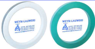
CAM-LOCK ALUMINIUM NBR dichting temp. -10°C +60°C RVS 316 (CF8M) NBR dichting temp. -10°C +60°C MESSING NBR dichting temp. -10°C +60°C OPTIE :dichtingen in EPDM VITON PTFE + VITON